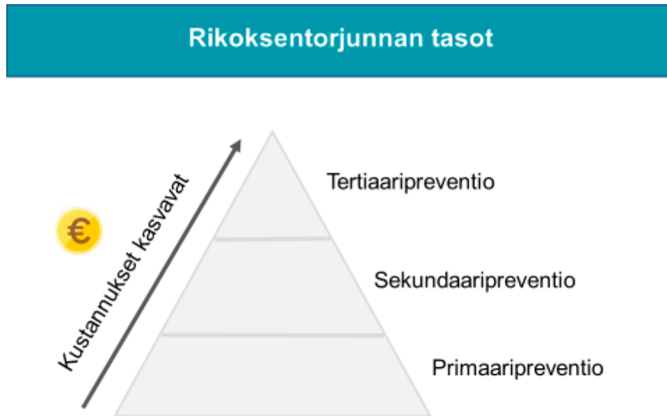
Kuvio 3. Rikksentorjunnan tasot ja kustannuksien muutos