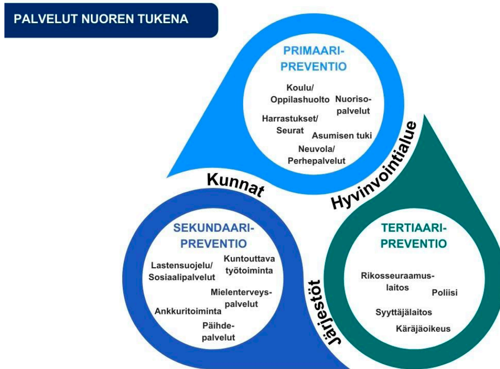
Kuvio 4. Rikoksilla oireilevien nuorten auttamiseen erikoistuneet palvelut.

Kuten kuviossa 4 näkyy, voivat lapsen, nuoren ja perheen hyvinvointia tukevat, ja samalla rikollisuutta ehkäisevät toimet kohdistua siis yksilöön tai perheeseen. Päihde- ja mielen-terveyspalvelut tai kuntouttava työtoiminta voivat olla tertiaariprevention toimia, ja tarpeellisia esimerkiksi vankilasta vapautuvalle tai vakavasti päihdeongelmaiselle nuorelle rikoskierteestä irrottatumista tukemaan. Käytännössä raja sekundaari- ja tertiaariprevention toimien välillä on liukuva. Kuvioista puuttuu myös sellaiset toimet, jotka kohdistuvat alueisiin tai ympäristöön.