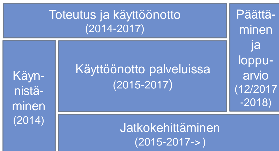
Kuva 3: Ohjelman pääpiirteittäinen vaiheistus