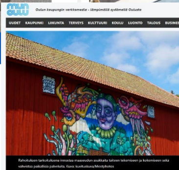
Rahokkosen tarkkukokona innostaa maaseudun asukkailla taitteen kokemiseen ja kokemiseen poka vahvistaa paikallista palveluita.