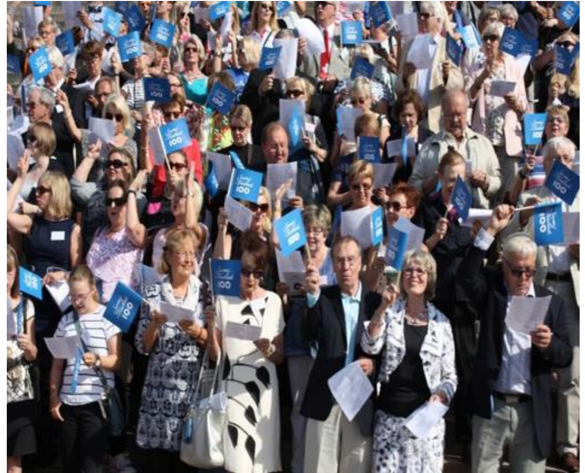
Ulkosuomalaiset laulavat 100-vuotiaalle Suomelle kesäkuussa 2017.