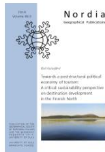
Nordia Geographical Publications VOL 48 NRO 3 (2019)