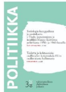
Poliitiikka-lehti VOL 61 NRO 3 (2019)