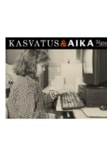
Kasvatus & Aika VOL 13 NRO 3 (2019)