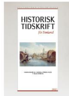
Historisk Tidskrift för Finland VOL 104 NRO 1 (2019)