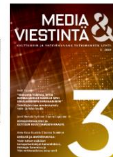
Media & viestintä VOL 42 NRO 3 (2019)