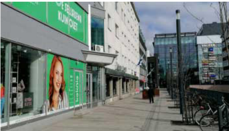
Oulussa kävelykatujen sulatusjärjestelmä luo esteettömän jalankulkuympäristön ja säästää kiinteistöjen kunnossapitokuluja.

Keskustan saavutettavuutta on lisätty rakentamalla polkupyöräbaanoja ja -parkkeja, joiden talvikunnossapito on esimerkillistä.