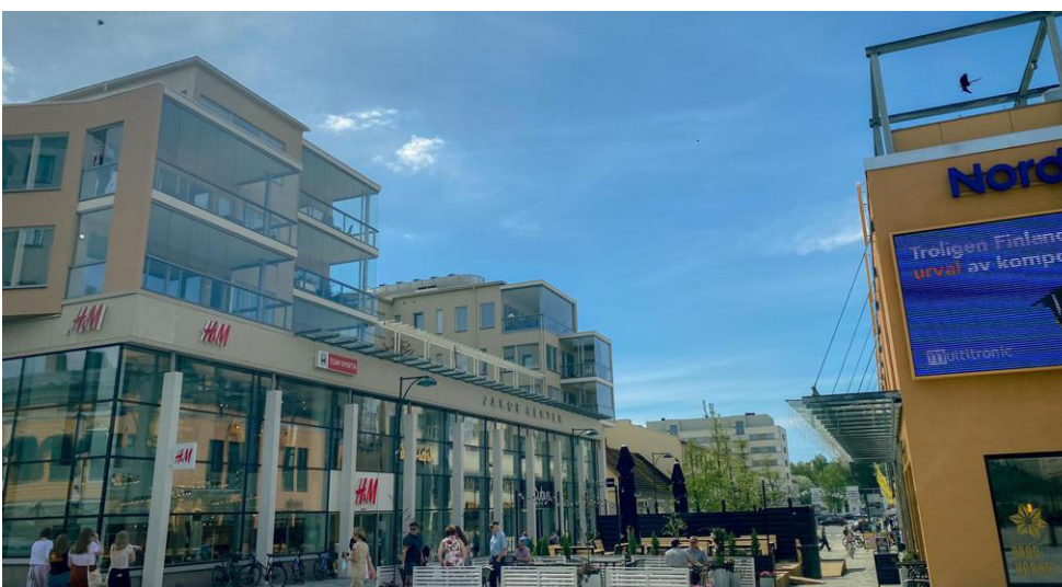
Pietarsaarella pikkukaupungin kaikki kaupat ovat keskustassa ja elinvoima on noussut jopa pandemiavuonna.