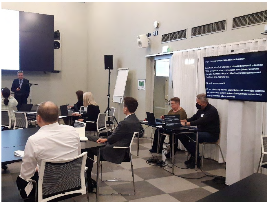
11.5.2022 hybriditilaisuutena järjestetty pyöreän pöydän keskustelu.