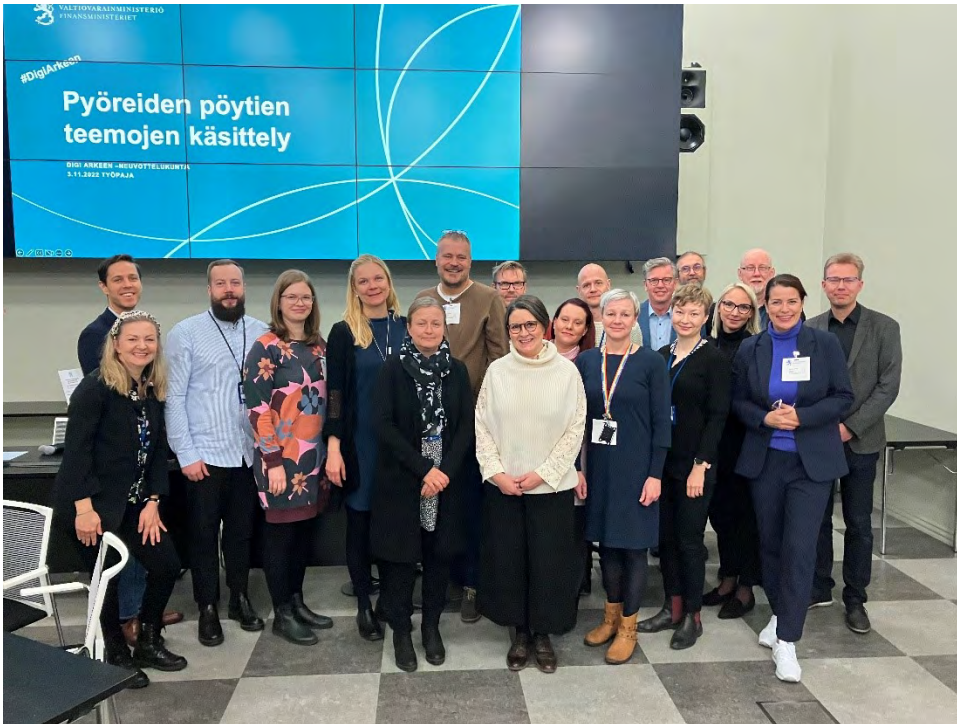
Neuvottelukuntalaisia 3.11.2022 työpajassa.