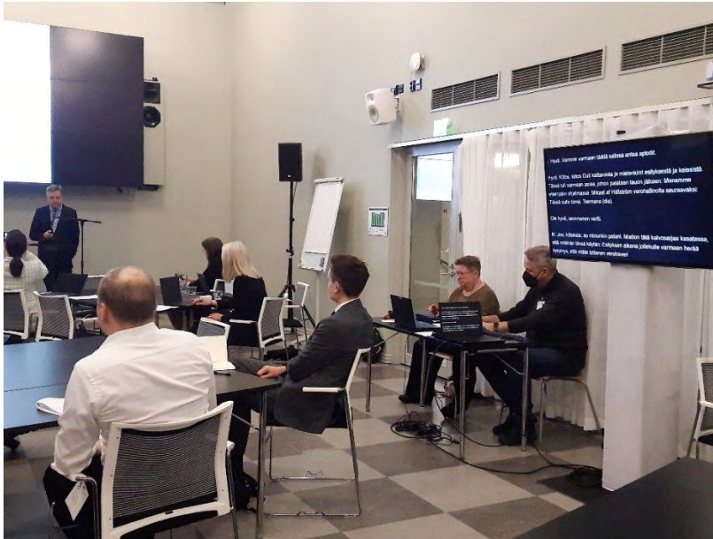
11.5.2022 hybriditilaisuutena järjestetty pyöreän pöydän keskustelu.