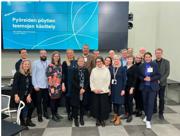
Neuvottelukuntalaisia 3.11.2022 työpajassa.

– Kuvia tilaisuuksista ja kokouksista, esimerkkinä [käyttöluvat, kuvaajatiedot ja alt-tekstit huomioitava] :