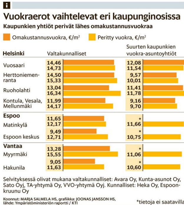
Kuva 1 HS 6.4.2013:

”Yleishyödylliset” vuokratyhtiöt perivät asukkailta enemmän vuokraa kuin kunnalliset.