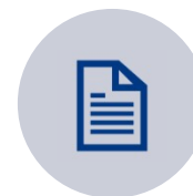
PAPERI JA PAPERITUOTTEET