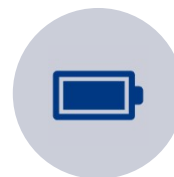
AKUT JA PARISTOT