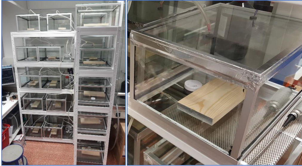
Kuva 2. Olosuhdekammiot (vasen kuva) ja sisällä oleva näyte (oikea kuva). Jokaiseen kammioon syötettiin vakioitu ilman tilavuusvirta 0,2 l/min. Kammion kansi tiivistettiin aina sulkemisen jälkeen alumiiniteipillä hallitsemattomien ilmavuotojen eliminoimiseksi. Oikeanpuoleisessa kuvassa näkyy myös koekappaleen alumiiniteipillä suljettu pääty sekä valkoinen kiekko, joka on Bluetooth-yhteydellä toimiva Ruuvi Tag -kosteus- ja lämpötila-anturi.

Haihtuvien orgaanisten yhdisteiden näytteet kerättiin pumppujen avulla Tenax TA-adsorbentteihin olosuhdekammioista (keräysaika 30 min). VOC-näytteet analysoitiin kaasukromatografisesti TD-GC-MS-laitteistolla (termodesorptio, kaasukromatografi ja massaspektrometri). Yhdisteet tunnistettiin standardiyhdisteiden ja massaspektrikirjastojen avulla. Yhdisteiden pitoisuudet laskettiin ns. tolueniekvivalenttina, jota käytetään yleisesti haihtuvien orgaanisten yhdisteiden sisäilmamittauksissa. Mittauksissa käytettiin ISO 16000-6 -standardimenetelmää.