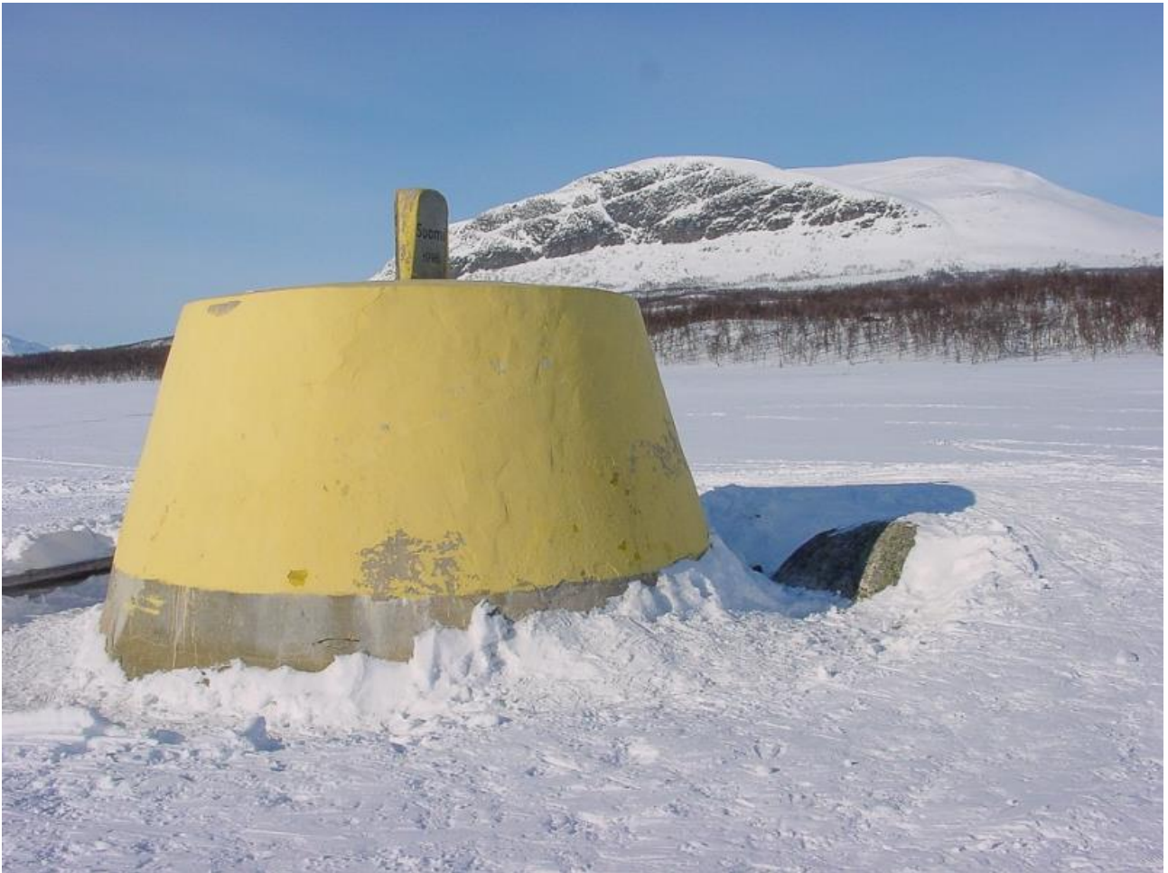
Kuva 2. Kolmen valtakunnan rajapyykillä kansainvälisyys on aistittavissa.

valtioiden välisiä rajoja. Se oli hyvin havaittavissa keskusteluissa, jotka käytiin rajapyykille saavuttua. Rajoista välittämättä saamelainen kulttuuriympäristö esittäytyi omine tunnusmerkkeineen.