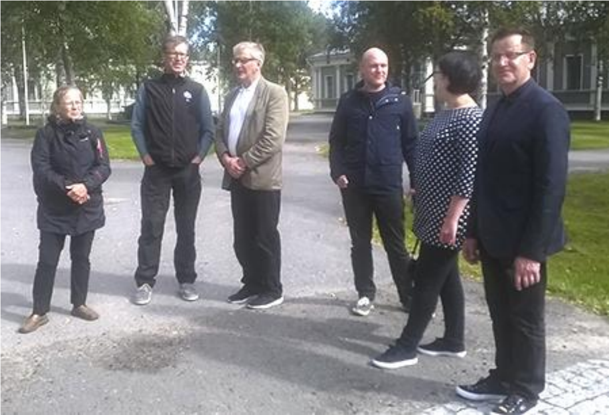
Kuva 1. Kulttuuriympäristötoimijat verkostoituvat keskustelujen avulla.