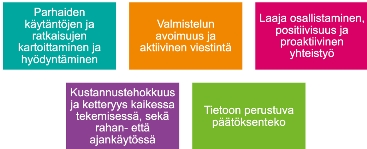
Kuva 3. Hankkeen yhteiset toimintatapalinjaukset

Toimeenpanohankkeen työskentelytavoista pidetään yllä tiivistä ja tarpeen mukaan päivitettävää kalvoesitystä hankkeen Teams-tiimissä sen Yleinen-kanavalla. Ajankohdan 27.6.2024 on tämän hankesuunnitelman liitteenä (Liite 4: Hankkeen toimintatavat ja hankehallinta -diat, 27.6.2024 versio).