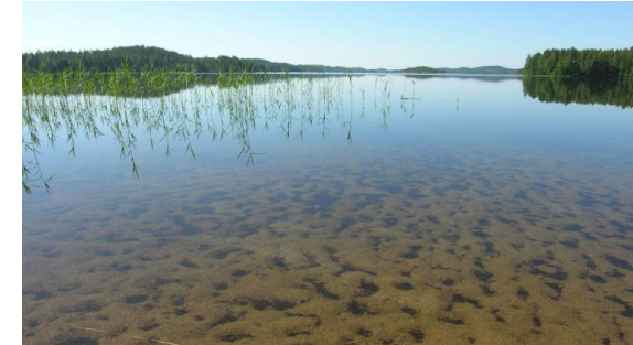
Sisävesiluontotyyppejä esim. karut kirkasvetiset järvet (3130)