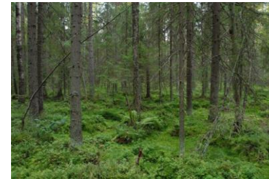
Suoluontotyyppejä, esim. puustoiset suot (91D0*)