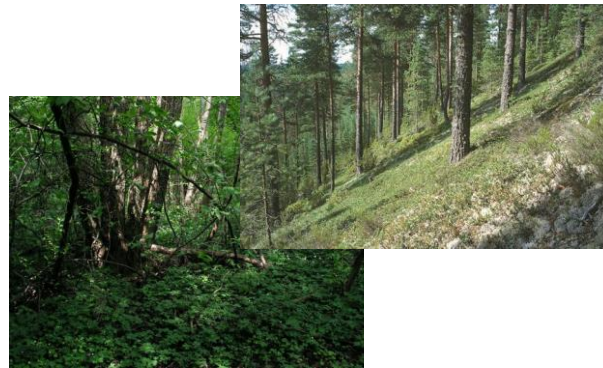
Metsäluontotyyppejä, esim. harjumetsät (9060), lehdot (9050)

Perinnebiotooppeja, kallioluontotyyppejä, tunturiluontotyyppejä jne.