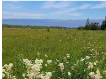
Itämeren rannikon luontotyyppejä ja dyyniluontotyyppejä, esim. variksenmarjadyynit (2140)

Perinnebiotooppeja, kallioluontotyyppejä, tunturiluontotyyppejä jne.