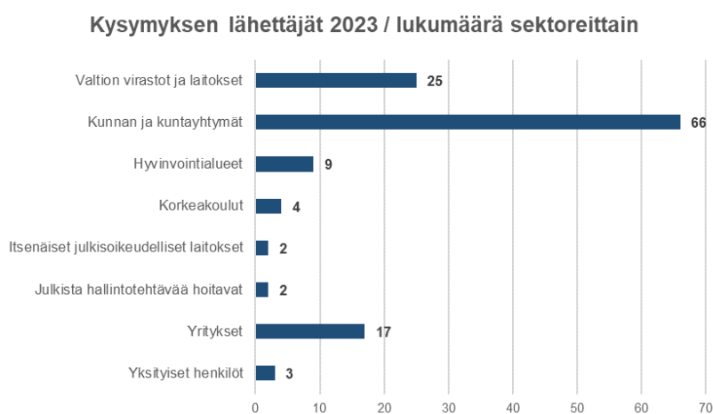
Kuvio 4. Tiedonhallintalautakunnalle kysymyksiä lähettäneet organisaatio sektoreittain

Eniten vastaanotettiin kysymyksiä, jotka liittyivät asiakirjojen säilytysaikojen määrittelyyn sekä näistä annettuihin tiedonhallintalautakunnan suosituksiin. Lukumäärällisesti suuren osuuden sihteeristön toteuttamasta neuvonnasta muodostivat tiedonhallintalautakunnan viestintää (tilaisuudet, tilaisuuksien tallentaminen ja jakelulistat) koskevista kysymyksistä. Keväällä 2023 toteutettu mittava laillisuusarviointi tiedonhallintamallin ylläpidosta muodosti myös kysymyksiä tiedonhallintalautakunnan sähköpostilaatikkoon.