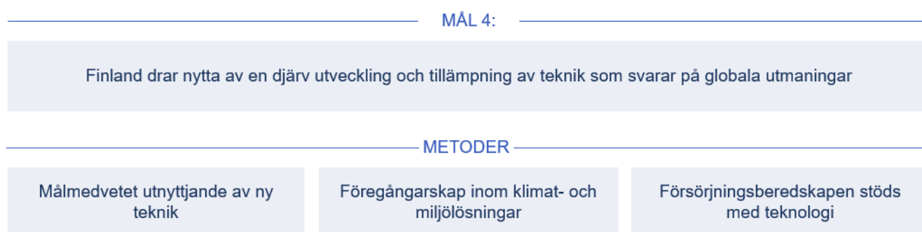
Bild 5. Mål 4: Finland drar nytta av tillämpningen av teknologier som svarar på globala utmaningar

Finländska högskolor, forskningsinstitut och företag ska utveckla kompetens i världsklass, eftersom Finlands tillväxt och förnyelse förutsätter god teknisk, men också affärsmässig och kreativ kompetens. I Finland bör man snabbt utveckla och ta i bruk teknik och helhetslösningar som hjälper Finland att bli världens första koldioxidneutrala samhälle för cirkulär ekonomi samtidigt som vi skyddar den biologiska mångfalden och Finlands koldioxidhandavtryck växer. Finland har alla förutsättningar att bli en större aktör i förhållande till sin storlek när det gäller detta tema.