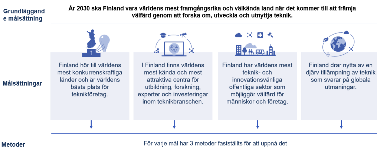
Bild 1. Mål som gör Finland till global ledare med hjälp av teknik och information

För att konkretisera dessa mål har varje mål delats in i tre åtgärdsområden som presenteras i kapitel 3.2. Det är fråga om långvarig, omfattande utveckling som bör fortsätta över valperioderna och preciseras i takt med att åtgärderna 3 utvecklas. Förutom att ställa upp mål är det viktigt att följa upp hur de uppnås och skapa en uppföljningsmodell för detta ändamål (kapitel 4).