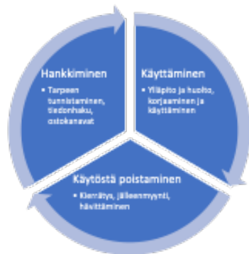
Kuva x. Kulutuksen prosessi

Kuluttajakäyttäytyminen ei muodostu pelkästään ostopäätöksen tekemisestä: käyttöön ja käytöstä poistamiseen liittyvät asiat ovat tulleet olennaiseksi osaksi kuluttajien päätöksentekoa. Kuluttajakäyttäytymiseen kuuluu ostopäätöksen ohella myös tuotteiden ja palvelujen hankinnan suunnittelu (ostoa edeltävä vaihe) ja käyttö, käytöstä poistaminen (kierrättäminen, uudelleenkäyttö jne.) sekä asiakkaiden keskinäiset suosittelut ja kanssakäyminen. Entistä useampi kuluttaja pohtii ostopäätöstä tehdessään esimerkiksi tuotteiden kierrätettävyyttä tai jälleenmyyntiarvoa kuluttajien välisessä kaupassa. Kulutuksen prosessi on kuvattu seuraavassa kuviossa. 2