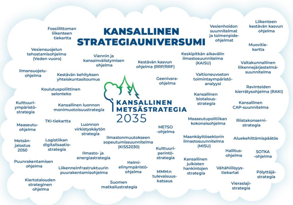
Kuvio 3. Kansalliseen metsästrategiaan linkittyviä kansallisia strategioita ja ohjelmia.

ja sen tavoitteisiin. Metsästrategialla on runsaasti liittymäkohtia muun muassa biotalousstrategiaan, luonnon monimuotoisuusstrategiaan, luonnon virkistyskäytön strategiaan, ilmasto- ja energiastrategiaan sekä maankäyttösektorin ilmastosuunnitelmaan (MISU) ja ilmastomuutokseen sopeutumissuunnitelmaan (KISS2030). METSO- ja Helmi-ohjelmat täydentävät kansallista metsästrategiaa ekologiseen kestävyteen liittyvissä tavoitteissa.