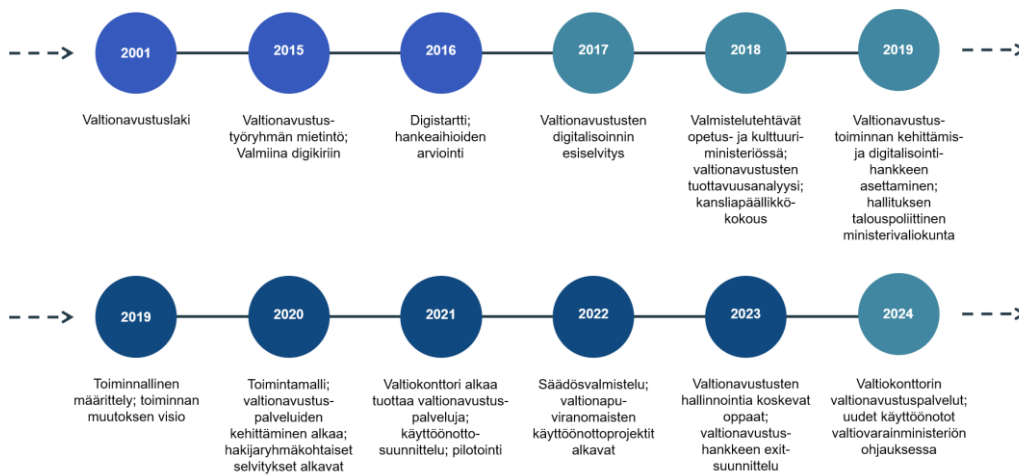
Kuvio 1. Valtionavustushanketta edeltäneet vaiheet ja hankkeen tiekartan päävaiheet

Valtionavustuslaki tuli voimaan vuonna 2001, millä pyrittiin yhtenäistämään valtionavustuksiin liittyviä käytäntöjä. Valtionavustustoimintaa koskevalta hallinnon kehittämistä alettiin vaatia yhä selkeämmin tuottavuutta ja vaikuttavuutta 2010-luvun edetessä; julkisen hallinnon digitalisaatiokehitys ja tietopolitiikka vaikuttivat myös vaatimuksiin. 22