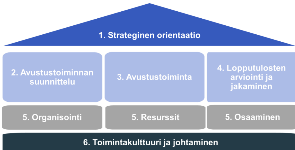
Kuvio 2. Kypsyysarvioinnin osa-alueet

Kypsyysarvioinnissa verrattiin valtionavustustoimintaan liittyvien strategisten tavoitteiden asettamisen ja seurannan tapaa valtionavustustoiminnan yhteiseen toimintamalliin (1 strateginen orientaatio). Sen lisäksi arvioitiin valtionapuviranomaisen valtionavustustoiminnan tilaa suhteessa yhteisen toimintamallin tavoitetilaan (2–4 valtionavustustoiminnan toimintamallin vaiheet). Arviointi koski myös toiminnan muutoksen toteuttamisen edellytyksiä valtionapuviranomaisessa (5 organisointi, resurssit ja osaaminen sekä 6 toimintakulttuuri ja johtaminen). Arvioinnista koostettiin valtionapuviranomaiskohtaiset palautteet.