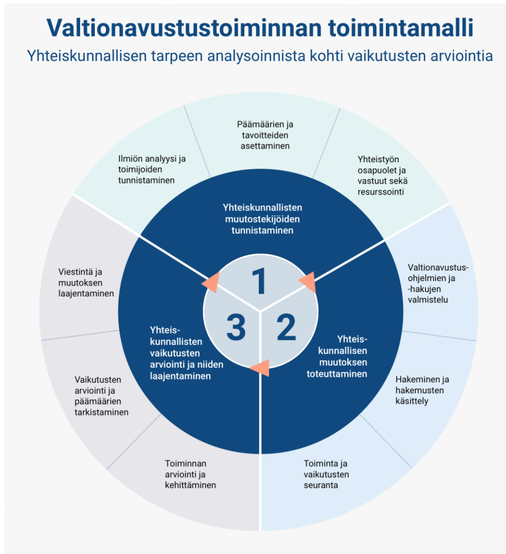
Kuvio 4. Valtionavustustoiminnan yhteinen toimintamalli

Valtionavustustoiminnan yhteisen toimintamallin periaatteita ovat ilmiölähtöisyys, verkostomainen yhteistyö ja vaikuttavuus, ja se vastaa valtionavustusten digitalisoinnin esiselvityksessä tunnistettuihin tarpeisiin vahvistaa tiedolla johtamista ja lisätä vaikuttavuutta valtionavustustoiminnassa. 106