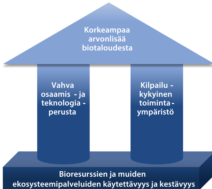
Kuvio 4. Biotalousstrategian strategiset painopisteet

Biotalousstrategian perustana toimii ekologinen, sosiaalinen ja taloudellinen kestävyys. Monille tekijöille on omia strategioita, joihin tämänkin strategian perusta rakentuu. Biotalousstrategian edistäminen tarvitsee edelleen vahvaa TKI-panostusta ja uusien innovaatioiden kauppal- listamisen tukea. Biotalousstrategian arvonnisan tukeminen tunnistettiin tärkeäksi painopistealu- eeksi, jota muut strategiat eivät tue tällä hetkellä. Arvonnisa on myös hyvä, erottuva kärki kansainvälisessä ja EU-vaikuttamisessa.