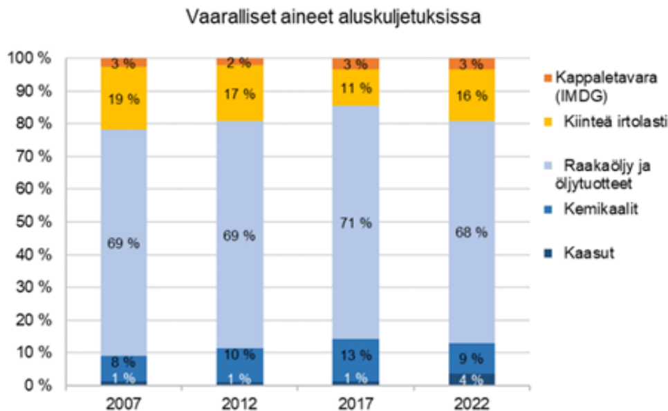
Kuva 1. Vaarallisten aineiden aluskuljetukset vuosina 2007–2022 irtolastiluokan mukaan.