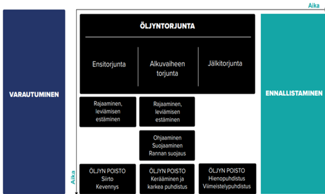
kuva 4. Öljyvahingon torjuntavaiheet. Öljytorjunnan vaiheet.

alue on todettu aistinvaraisesti puhtaaksi. Ennen jälkitorjunnan lopettamista koskevan päätöksen tekemistä jälkitorjuntaviranomainen on saattanut kuulla asiassa kunnan ympäristönsuojeluviranomaista, ympäristöteknistä asiantuntijaa tai Lupa- ja valvontavirastoa. Voimassa oleva lainsäädäntö ei edellytä kirjallisen päätöksen tekemistä jälkitorjunnan lopettamisesta tai ympäristövahinkoasiantuntijan kuulemista, minkä vuoksi myös jälkitorjunnan lopettamista koskevaan päätöksentekomenettelyyn liittyvät käytännöt vaihtelevat.