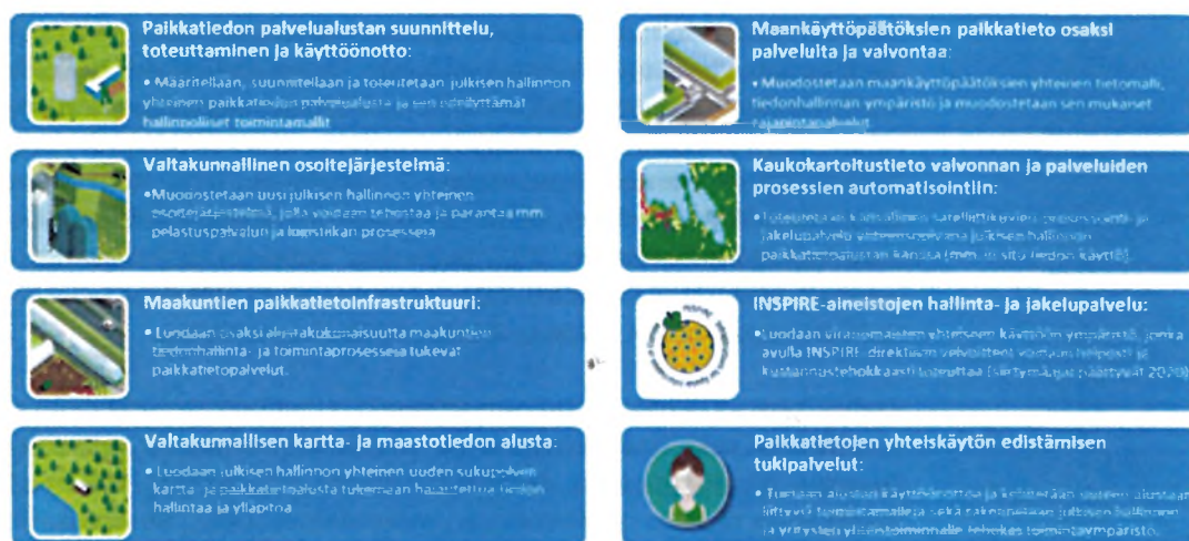
Kuva 2. Paikkatiedon palvelualue-hankkeen osahankkeet

Hankkeen tavoitteena on toteuttaa kahdeksan osahanketta liitteenä olevan hankesuunnitelman mukaisesti.