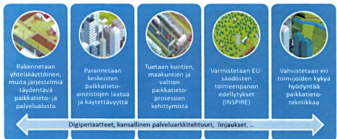
Kuva 1. Paikkatietoalusta-hankkeen yleiset tavoitteet

Hanke koostuu kahdeksasta osahankkeesta ja hankekokonaisuuden valmisteluun on osallistunut keskeisinä kumppaneina valtiovarainministeriö, ympäristöministeriö, Suomen Ympäristökeskus, Maanmittauslaitos ja Kuntaliitto. Hanke edellyttää osahankkeesta riippuen paikkatietojen yhteentoimivuuden, tietoprosessien ja arkkitehtuurien kehittämistä, kokonaan uusia järjestelmiä ja palveluita sekä kehittämistoimenpiteitä myös olemassa olevissa järjestelmissä.