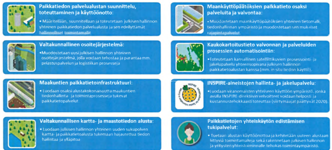
Kuva 2. Paikkatiedon palvelualusta-hankkeen osahankkeet.

Hankkeen tavoitteena on toteuttaa kahdeksan osahanketta alkuperäisen asettamis- päätöksen liitteenä olevan hankesuunnitelman mukaisesti.