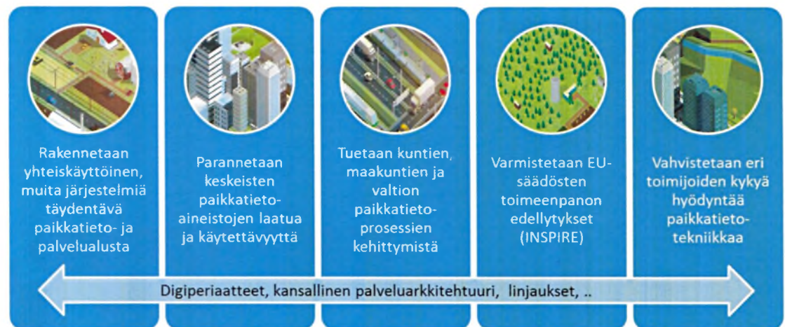
Kuva 1. Paikkatietoalusta-hankkeen yleiset tavoitteet

Hallitusohjelman toteuttamista tuetaan Digitalisoidaan julkiset palvelut -kärkihankkeella, jonka avulla julkisia palveluita pyritään rakentamaan käyttäjälähtöisiksi ja ensisijaisesti digitaalisiksi toimintatapoja uudistamalla. Julkisen hallinnon yhteinen paikkatiedon palvelualusta -hanke (Paikkatietoalusta-/PTA-hanke) on tähän kärkihankekokoaisuuteen kuuluva hanke.