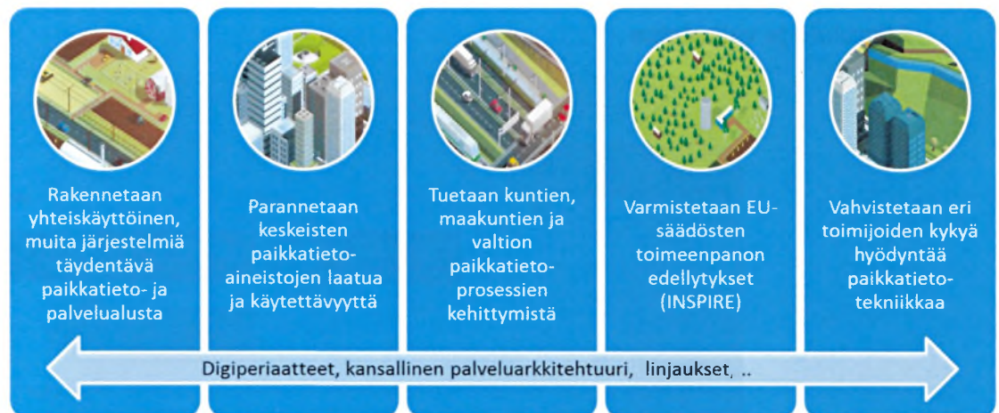
Kuva 1. Paikkatietoalusta-hankkeen yleiset tavoitteet

Hanke koostuu kahdeksasta osahankkeesta ja hankekokonaisuuden valmisteluun on osallistunut keskeisinä kumppaneina valtiovarainministeriö, ympäristöministeriö, Suomen Ympäristökeskus, Maanmittauslaitos ja Kuntaliitto. Hanke edellyttää osahankkeesta riippuen paikkatietojen yhteentoimivuuden, tietoprosessien ja arkkitehtuurien kehittämistä, kokonaan uusia järjestelmiä ja palveluita sekä kehittämistoimenpiteitä myös olemassa olevissa järjestelmissä.