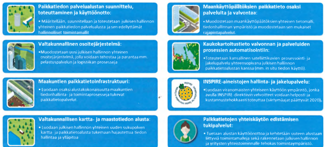
Kuva 2. Paikkatiedon palvelualue-hankkeen osahankkeet

Hankkeen tavoitteena on toteuttaa kahdeksan osahanketta liitteenä olevan hankesuunnitelman mukaisesti.