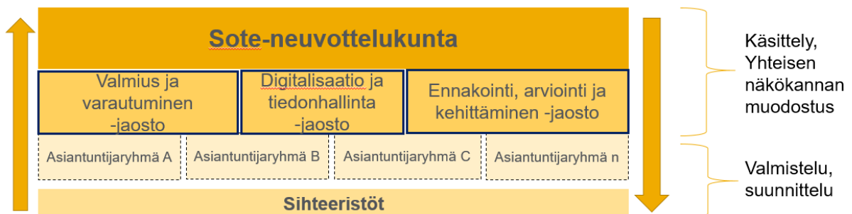
Kuva 1. Asioiden käsittely ja valmistelu sosiaali- ja terveydenhuollon neuvottelukunnan rakenteessa.

Neuvottelukunnan työskentelyä rytmittää hyvinvointialueiden ohjauksen vuosikello (kuva 2). Ohjausta varten tuotettujen kansallisten arviointien ja selvitysten keskeiset kansalliset tulokset ja teemat käsitellään neuvottelukunnassa. Hyvinvointialuekohtaiset selvitykset ja arvioinnit käsitellään pääsääntöisesti HVA-neuvotteluissa ja/tai muilla alueellisilla foorumeilla yhdessä kansallisten toimijoiden kanssa.