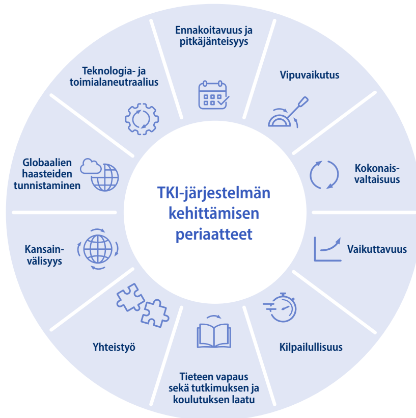
Kuvio 1. TKI-järjestelmän kehittämisen periaatteet

Suunnitelmaan on kirjattu linjauksittain lyhyellä aikavälillä tavoitellut tulokset, keskipitkän aikavälin vaikutustavoite ja pitkän aikavälin vaikuttavuustavoite sekä ehdotuksia potentiaalisiksi mittareiksi, joita suunnitelman toimeenpanon seurannassa hyödynnetään. Mittaristossa on niin panos- kuin tuotostittareita. Suunnitelmassa lyhyellä aikavälillä tarkoitetaan noin kolmen vuoden aikajännettä (nykyinen hallituskausi), keskipitkällä aikavälillä rahoituslain ajanjaksoa (2030 loppuun) ja pitkällä aikavälillä sen jälkeen syntyvää vaikuttavuutta. Luvussa 6 on kuvattu suunnitelman seuranta tarkemmin.