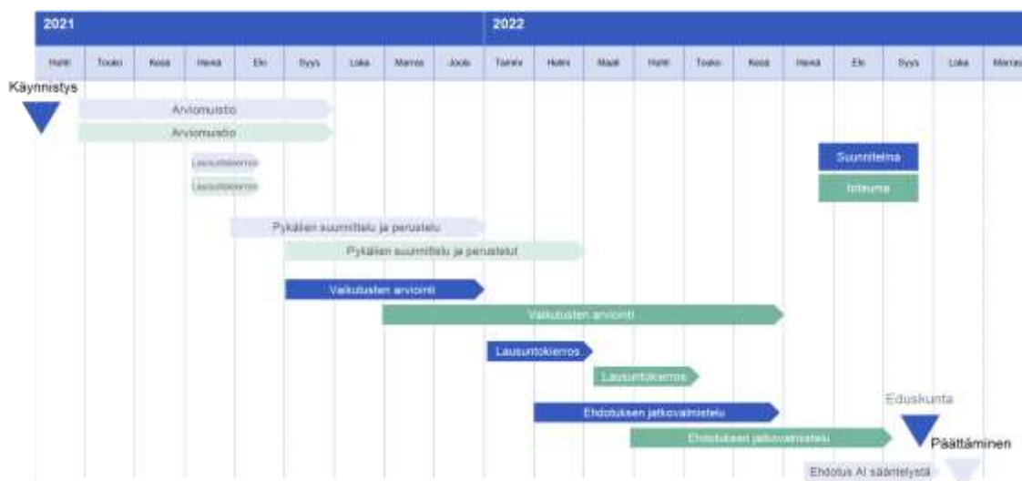
Kuva 2. Työryhmän rinnalla tehdyn valmistelun vaiheet ja aikataulu

Työryhmän työskentelyn rinnalla valtiovarainministeriön ja oikeusministeriön toimesta valmisteltiin arviointi ehdotuksen vaikutuksista sekä muu hallituksen esitysluonnoksessa tarvittavat sisältö.