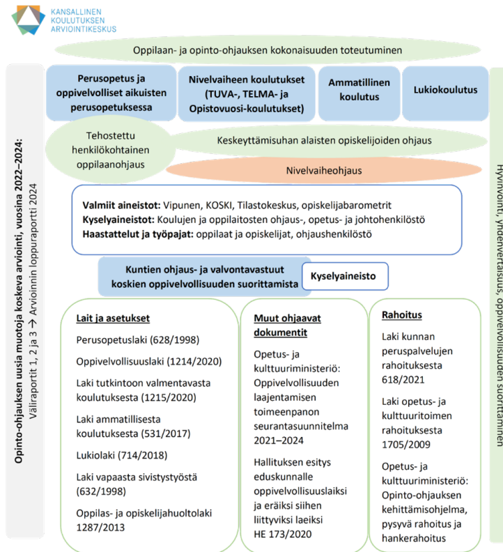
KUVIO 1. OHJA-arvioinnin kokonaisuus

Arviointiaineisto kerättiin vuosien 2023–2024 aikana eri toimijoille suunnatuilla kyselyillä, haastatteluilla ja työpajoilla. Lisäksi hyödynnettiin valmiita tilastoaineistoja. Arvioinnin kokonaisuutta havainnollistetaan kuviossa 1. Aineistonkeruu sekä sen raportointi esitetään taulukossa 1.