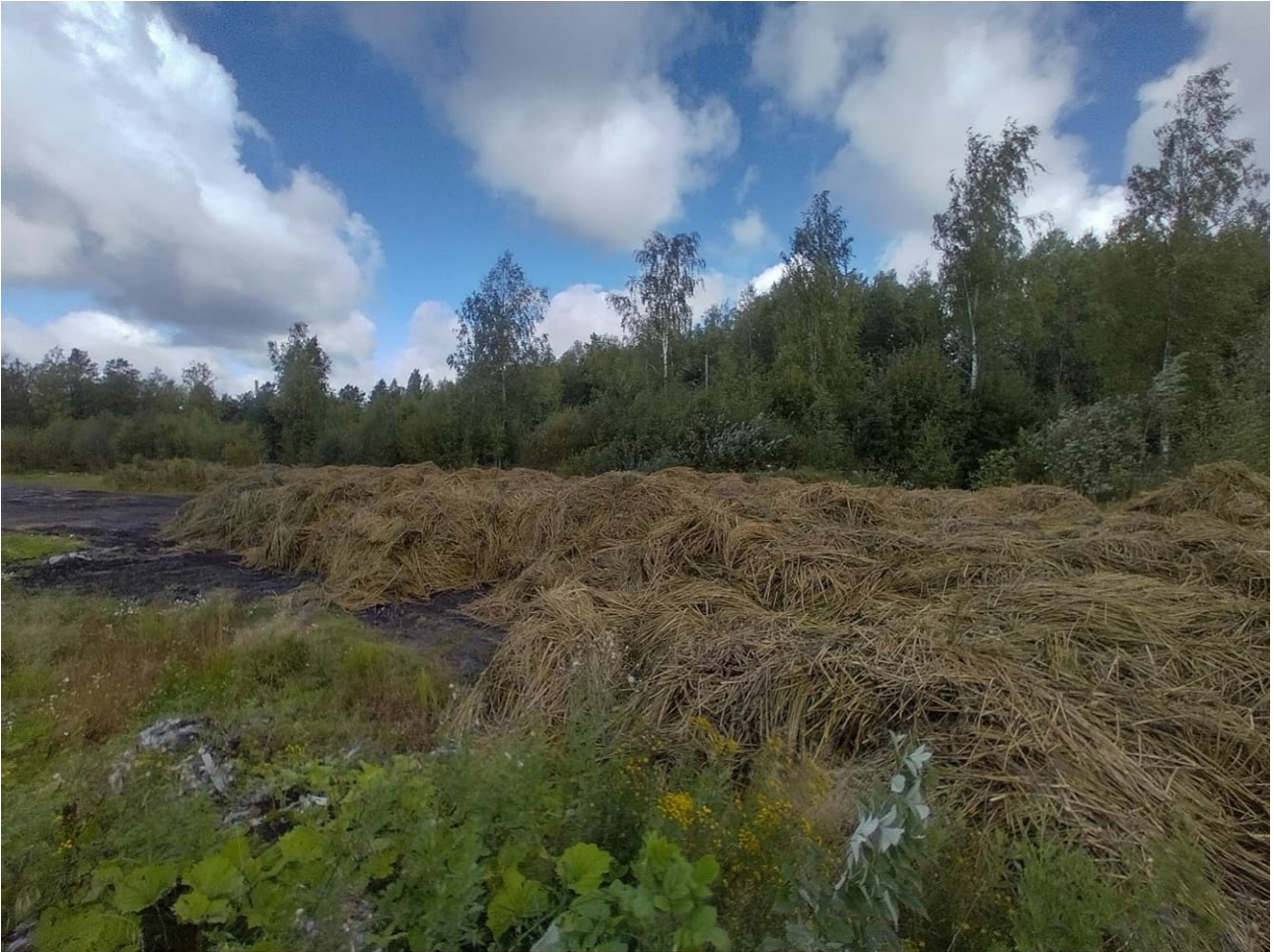
Kerättyä järviruokoa välivarastointialueella odottamassa murskausta.