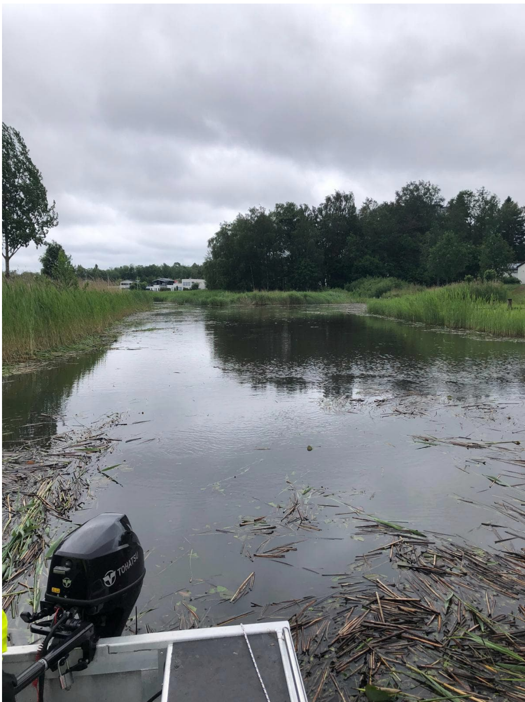
Järviruo'on niiton aloitus Vaasan Suvilahden asuntomessualueen poukamassa kesällä 2025.