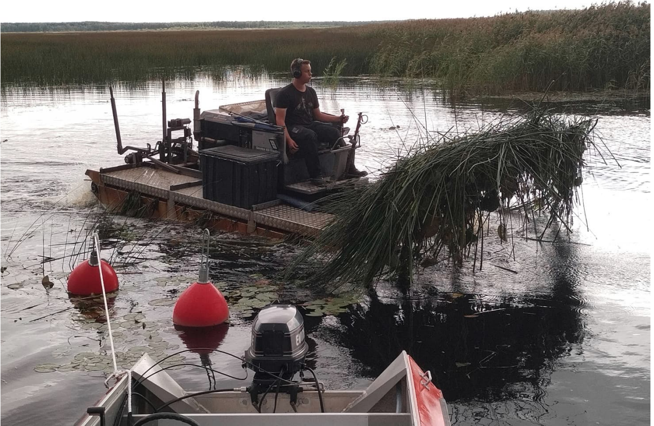
Niittourakoitsija Service KE-Trading Oy:n työkone työssä.