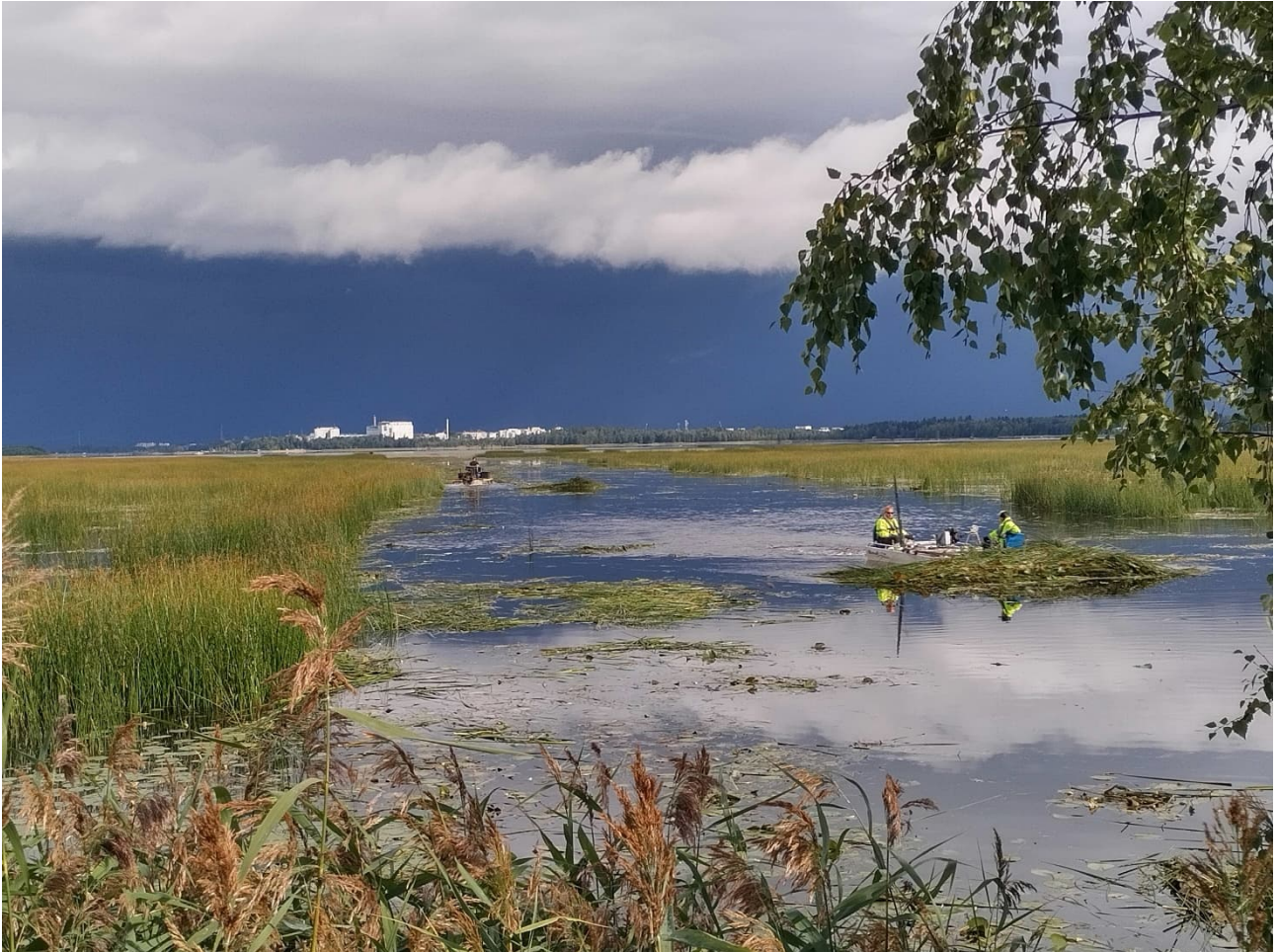
Väylä Munsmon satamaan on umpeutumassa ja väylän levennysniitto käynnissä.