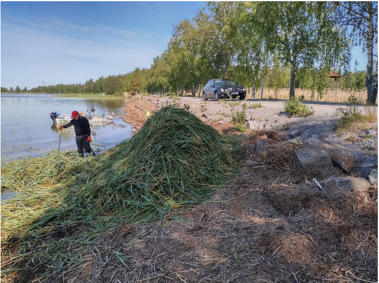
Jävriuo'on niittoa ja keräystä Vaasan Villan rannassa.