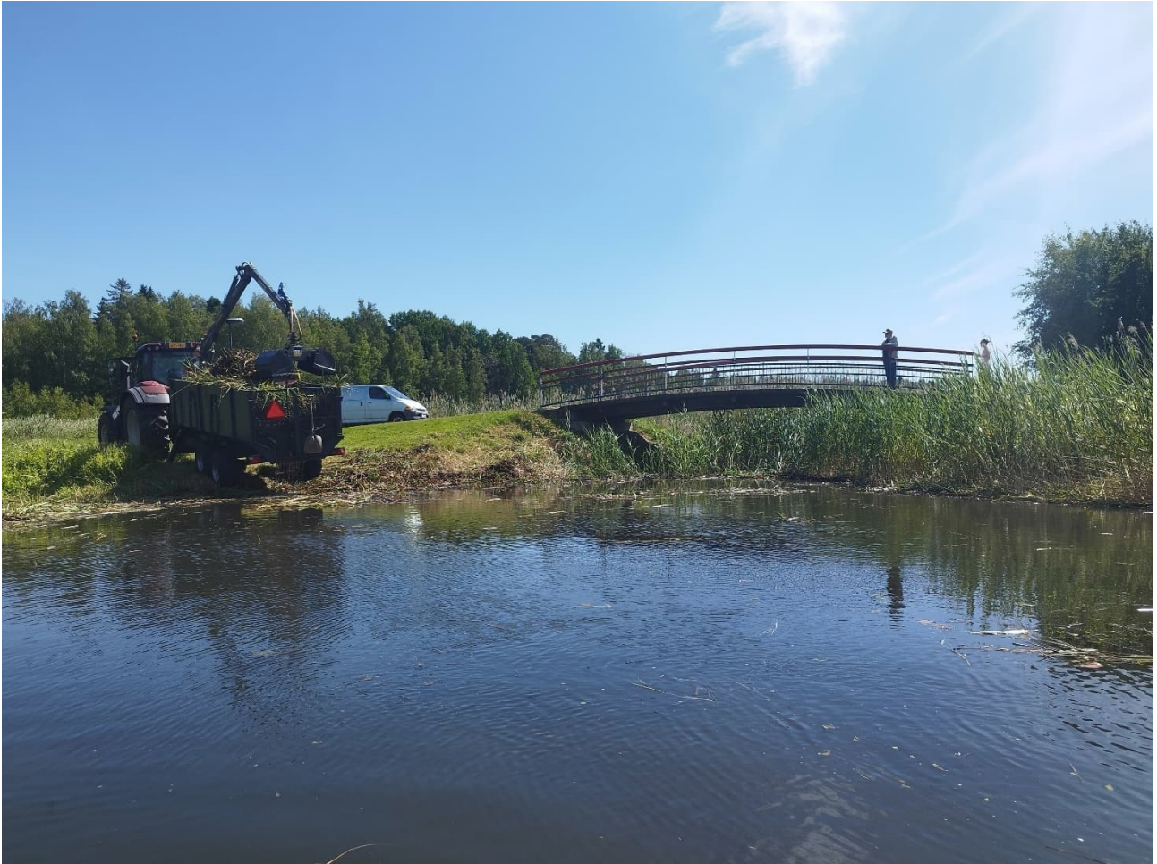
Järviruo'on keruuta Vaasan Suvilahden asuntomessualueella kesällä 2025.