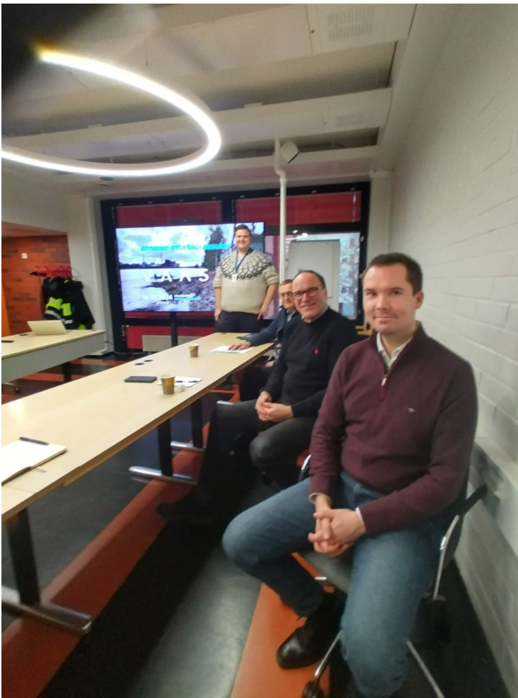
Järviruokoniitoista esitystä Gerbyn Saaristoyhdistykselle joulukuussa 2024.

Asukkaita ei osallistettu hankkeen aikana, ainoastaan tiedotettiin toimenpiteistä. Vastaisuudessa suunnitelmissa on osallistaa asukkaita ehdottamalla niitettäviä kohteita kaupungille ennen toimenpidelupien hakemista.