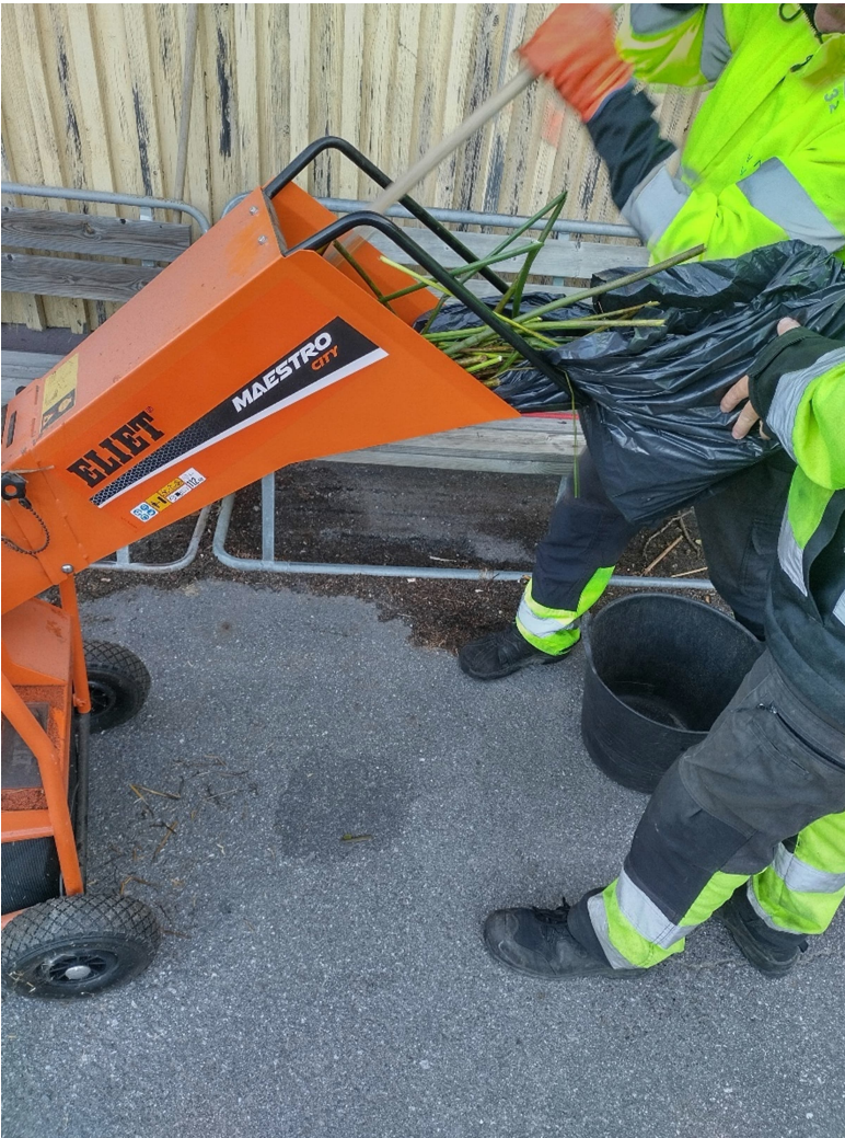
Työntekijät murskaamassa tuoretta järviruokoa metaanipitoisuusnäytettä varten.

metaania verrattuna tuoreeseen ruokomurskaan. Tuloksien perusteella huomasi, että reaktio ei kuitenkaan ollut päättynyt 31 päivän kokeessa, jolloin metaanin saantikaan ei ollut loppunut. Kokonaistulos on kuitenkin suuntaa antava ja huomioimme, että järviruo'on säilytystä tulisi vielä tutkia tarkemmin, jotta järviruo'on niittoprosessista saadaan mahdollisimman kustannustehokas. Etenkin metaanipitoisuuden lasku kuukaudessa olisi oleellinen tieto määrittämään mahdollisia kustannustehokkaita niittomääriä ilman metaanipitoisuuden laskua biomassan säilönnässä odottaen käyttöä. Järviruoko tulisi siis saada käyttöön nopeammin, jolloin säilyvyys olisi pienempi ongelma.