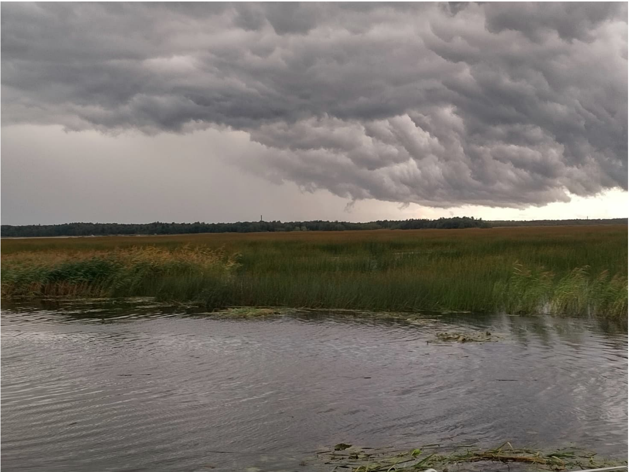
Myrsky nousemassa Munsmon satamassa, alla järviruokopelto kohti Laihianjokea.

järviruoko on mätänemisprosessissa sulavaa, heikolla synergistisellä vaikutuksella reaktorilietesekoituksen kanssa, ja heikolla negatiivisella vaikutuksella sekoitettuna biojätteen kanssa. Kuitenkin kokonaiskaasuntuotanto kasvaa sekoitettavan materiaalin valinnasta huolimatta ja järviruoko auttaa biokaasuntuotannossa. Talvella kerätystä järviruokonäytteessä on korkeampi osuus Volatile Solids (tulenarat kiinteät ainekset), mutta ruoko osaksi kelluu reaktoriastian pinnassa, etenkin sekoitettuna biojätteen kanssa. Tulokset kesän järviruokonäytteestä reaktorilietteen kanssa olivat hieman odotettua alhaisemmat, joka johtunee hetkittäisestä häiriöstä biokaasuntuotantolaitteistossa näytelaboratoriossa.