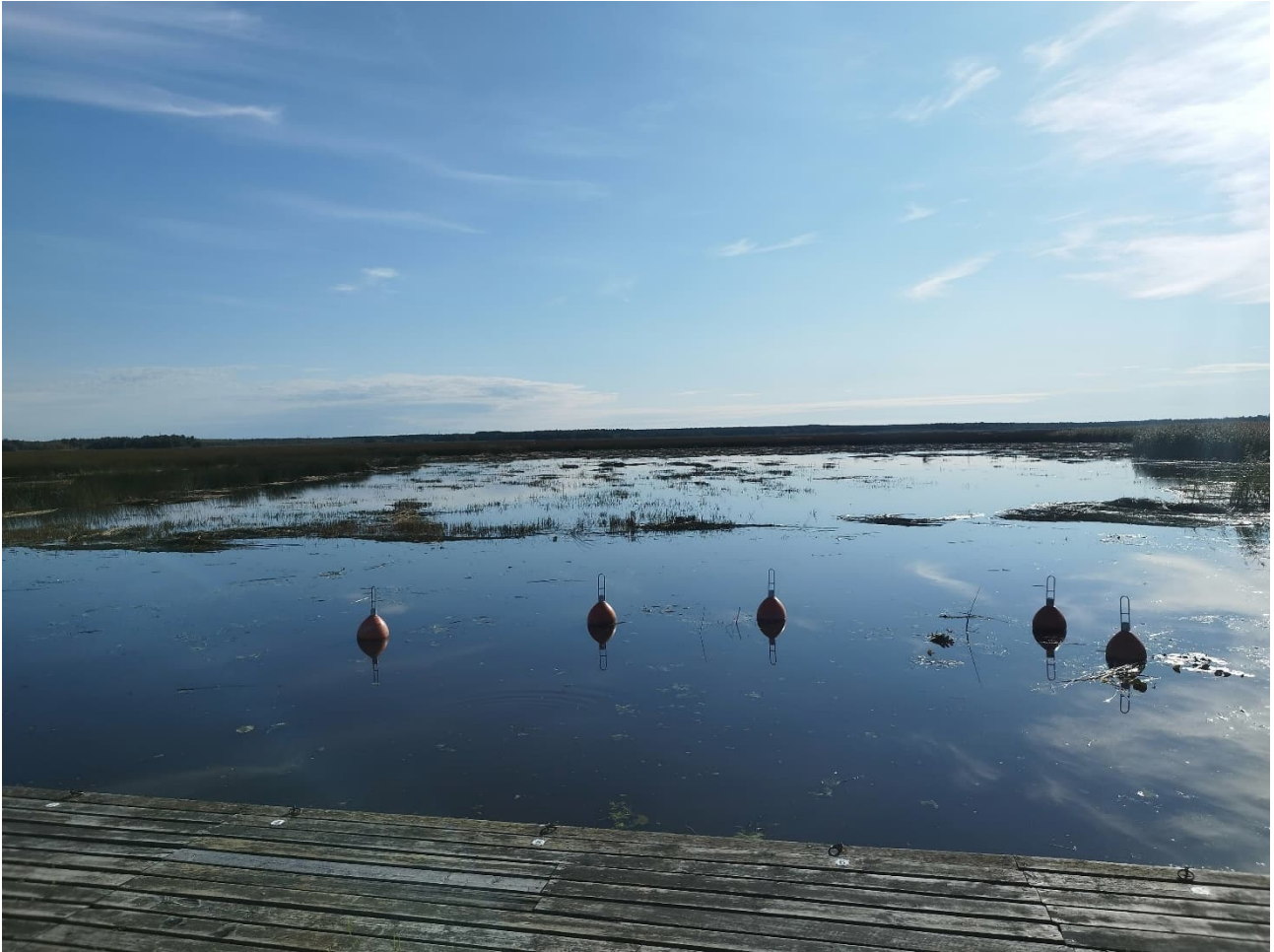
Järviruoko-osuutta niittojen jälkeen, kuvasta huomaa veden mataluuden paikoin järviruokopeltoa.