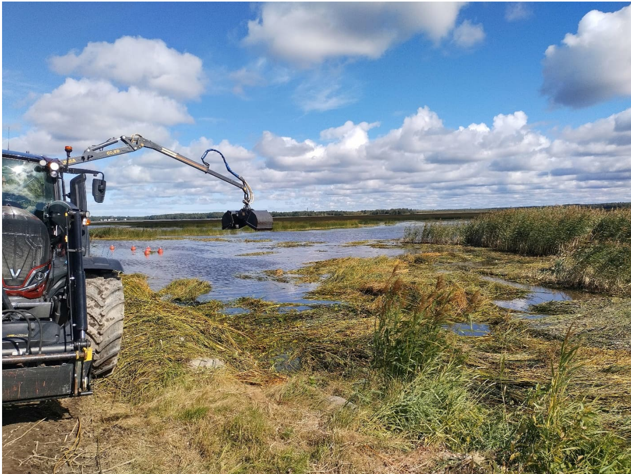
Kerättävä järviruoko odottaa nostoa vedestä.