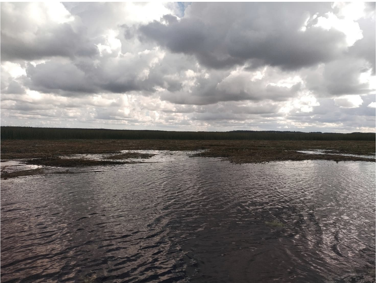
Kuvassa haastava työalue niiton jälkeen, kaupungin oma niittovene ei kykene vesijättömaalla työhön.

Hankkeen aikana saimme toteutettua investointisuunnitelman mahdollisimman kustannustehokkaaseen järviruo'on niittoon. Tutkimme ja löysimme keskeisimmät pullonkaulat, jotka vaikuttavat prosessiin kustannuksia nostavasti.