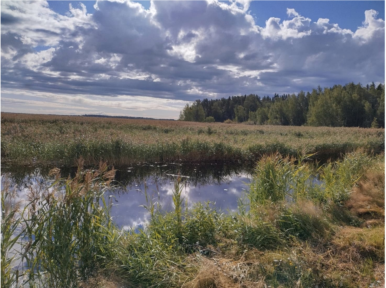
Munsmoan sataman väylä veneenlaskupaikalle on lähellä umpeenkasvua, tilanne ennen niittojen aloitusta.