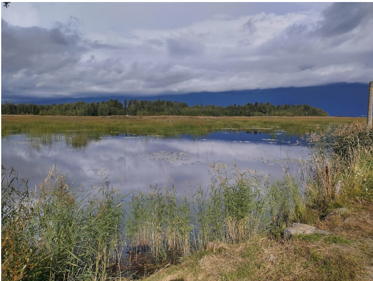
Kuvaa Munsmon sataman länsipuolelta niittotyön aikana.