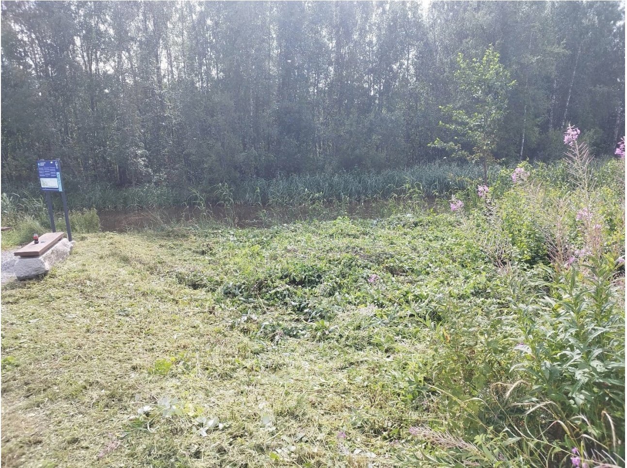
Vanhan Vaasan kanaalinsuu, raivattu alue mahdollinen järviruo'on nostopaikka.