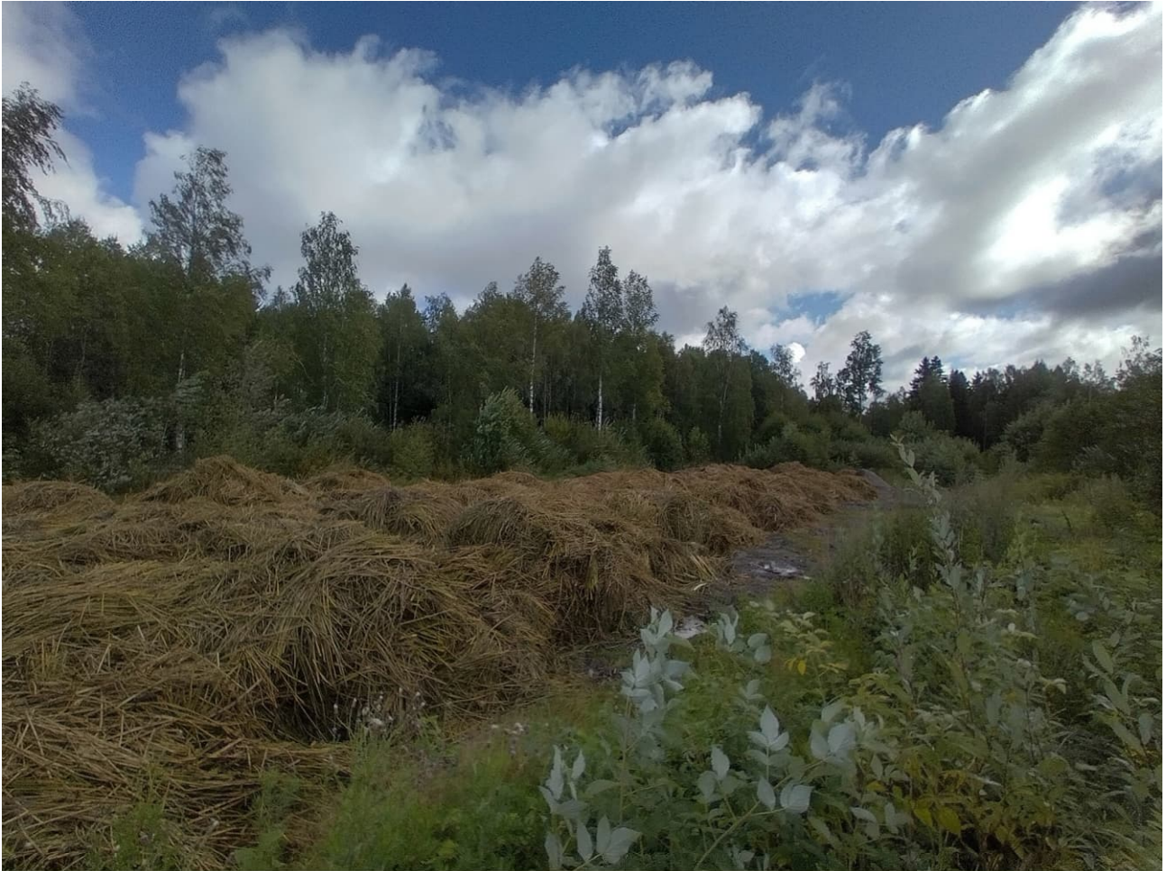
Järviruokoa ennen murskausta, seuraavassa kuvassa samasta paikasta kameraa vasemmalle ottaen kuvaa