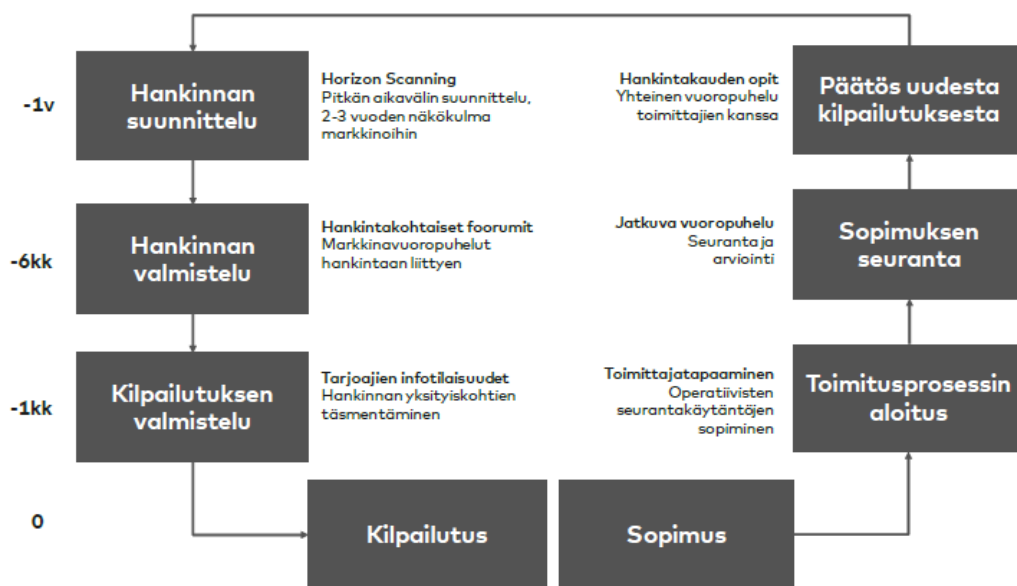
Kuvio 1. Kasvupalvelujen markkinavuoropuhelun toteutusmalli.

Kasvupalvelujen markkinavuoropuhelun toteutusmallia on kuvattu TEM:n hankkeessa Tu- losperusteisen tulospalkkiokriteeristö ja hankinta (Owal Group Oy 8.11.2017).