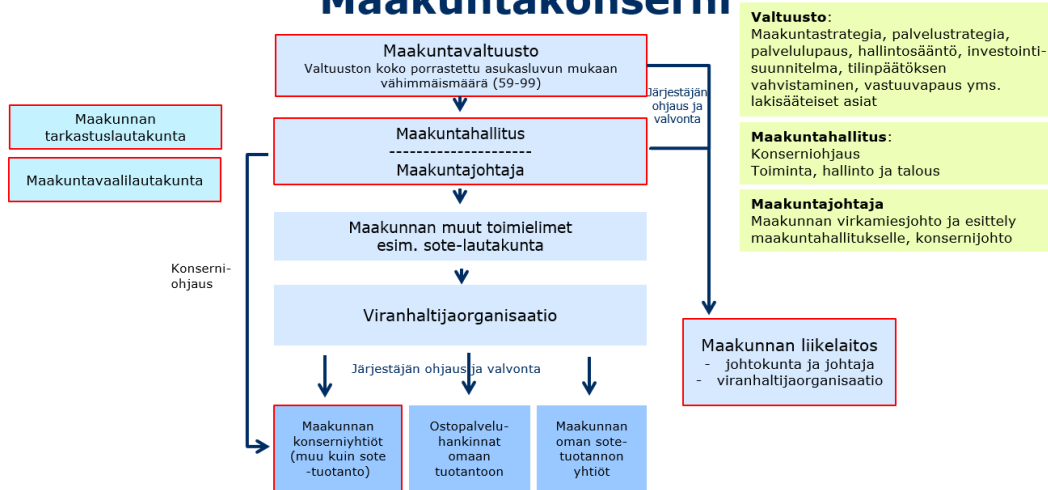
Kuvio: NIMI ja lähde

Järjestäjäorganisaatio voidaan esimerkiksi rakentaa perinteiseen tapaan liittämällä siirtyvät organisaatiot osaksi maakuntaorganisaatiota erillisinä yksikköinä, kuitenkin varmistaen synergiaedut arvioimalla kunkin yksikön tehtäviä kokonaisuutena. Tässä kuitenkin on vaarana sektoreiden ja toiminnan siiloutuminen. Organisaatio voidaan rakentaa myös yleisten järjestäjän toimintojen ja tehtävien mukaisesti. Tällä tavoin voidaan jossakin määrin välttää järjestäjäorganisaation siiloutuminen perinteisten sektoreiden mukaisesti. Seuraavassa kuvassa esitetään yksi malli, jossa matriisiorganisaatiossa resurssit on organisoitu järjestäjän geneeristen toimintojen mukaan ja palvelukokonaisuudet puolestaan funktioittain. Funktiot voivat edustaa esimerkiksi asiakassegmenttejä, joiden tarpeisiin palvelut järjestetään kokonaisuuksittain. Järjestäjäorganisaation rakentaminen tiiviiksi osaksi maakunnan konsernihallintoa (järjestämisen sekä konserniohjauksen yhdistäminen) mahdollistaa resurssien tehokkaan käytön sekä voi estää tilaaja–tuottaja-malleista tutun konserniohjauksen ja järjestäjän ohjauksen väliset ristiriitaiset tavoitteet.