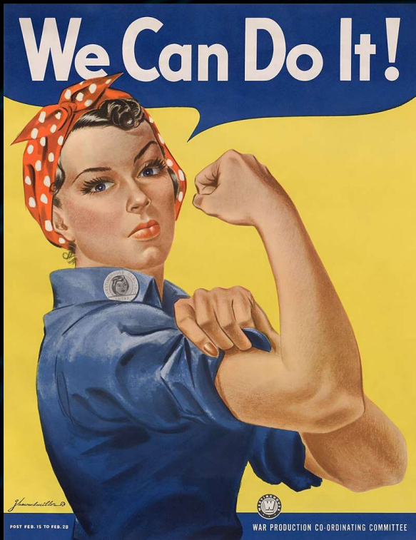
J. Howard Miller "We can do it", 1943