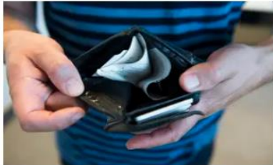
Käteinen raha on katoamassa, mikä voi tehdä valkeammaksi hahmottaa kulutusta.

Lukijan mielipide | Taloustaitojen opettaminen on jo osa peruskoulun opetussuunnitelmaa, vaikka sen nimistä oppiainetta kouluissa ei olekaan.