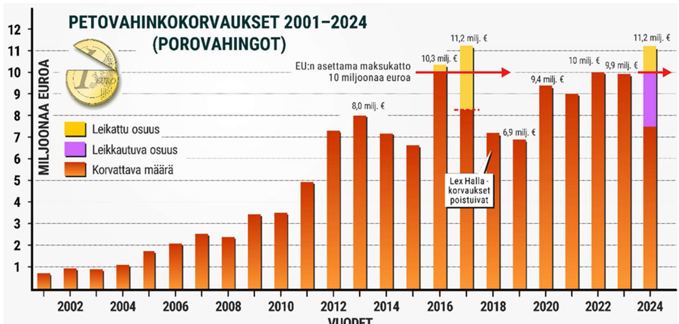
Kuva 2. Petovahinkokorvaukset ja niiden leikkaukset 2000–2024.

Petovahinkojen määrä on kasvanut huomattavasti vuosituhannen alusta. Vuonna 2000 suurpetojen tappamia poroja löydettiin koko poronhoitoalueelta 2804, kun taas vuonna 2024 määrä oli jo 6474, mikä merkitsee peräti 131 prosentin kasvua.