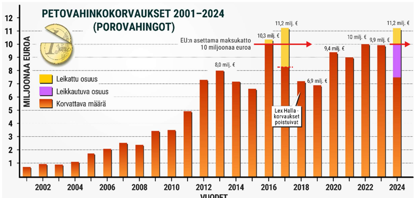
Kuva 2. Petovahinkokorvaukset ja niiden leikkaukset 2000–2024.

Petovahinkojen määrä on kasvanut huomattavasti vuosituhannen alusta. Vuonna 2000 suurpetojen tappamia poroja löydettiin koko poronhoitoalueelta 2804, kun taas vuonna 2024 määrä oli jo 6474, mikä merkitsee peräti 131 prosentin kasvua.