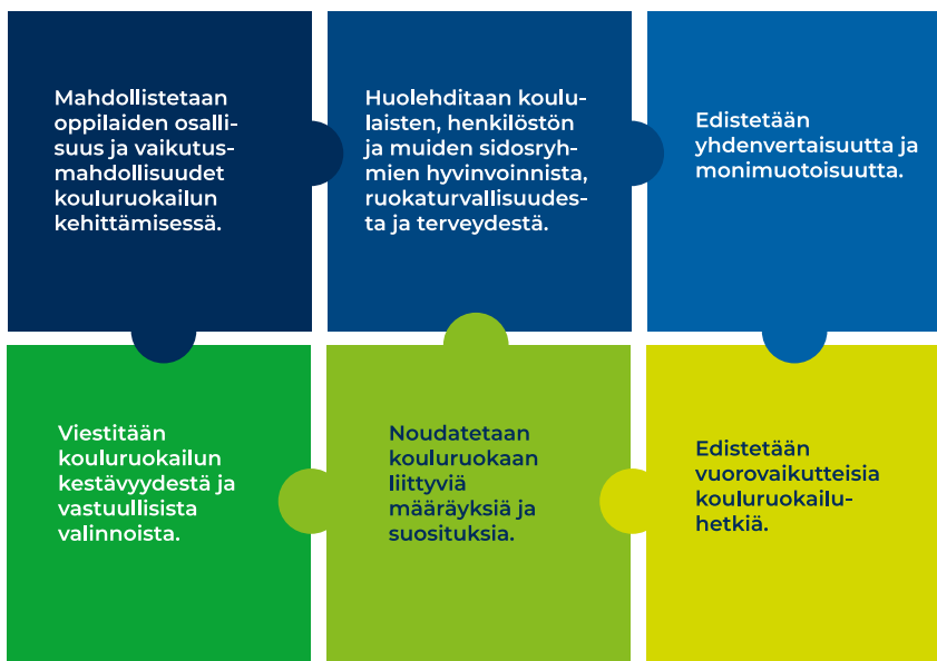
Kuva 11. Sosiaalinen vastuullisuus kouluruokailussa.

Kouluruokailulla on keskeinen merkitys kouluympäristössä sosiaalisen vastuullisuuden rakentajana ja osallisuuden edistämisessä.