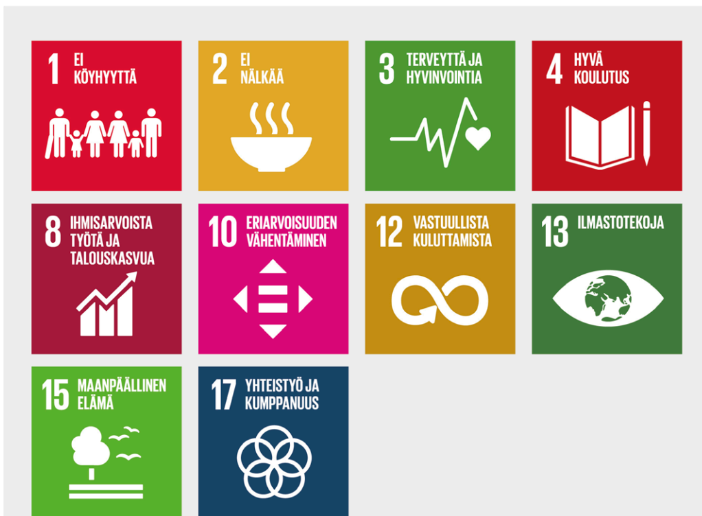
Kuva 9. Kouluruokailu edistää useita YK:n kestävän kehityksen tavoitteita.

Euroopan vihreän kehityksen ohjelmalla 86 ja siihen liittyvillä Pelloilta pöytään -strategialla 87 ja Biodiversiteettistrategialla 88 pyritään säilyttämään sekä luonnon monimuotoisuutta että suuntaamaan Eurooppaa kohti ilmastoneutraalisuutta. Tavoitteena on luoda terveyttä edistävä, reilu ja kestävä ruokajärjestelmä alkutuotannosta ruokapöytään kestäville ruoantuotantomenetelmillä ja ruokahankinnoilla sekä puolittamalla ruokahävikki vuoteen 2030 mennessä.