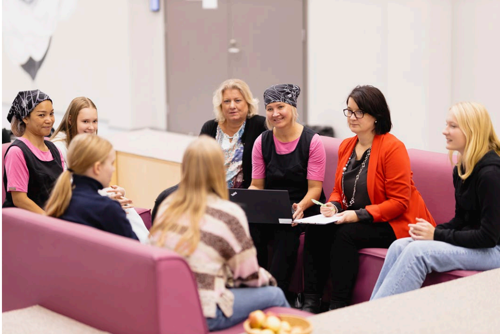
Kuva 14. Oppilaiden ja opiskelijoiden kuuleminen on keskeinen osa kouluruokailun kehittämistä.

Nuoret haluaisivat antaa palautetta toisinaan keittiöhenkilökunnalle henkilökohtaisesti, mutta se vaatisi usein henkilökunnan ja nuorten välisen vuorovaikutuksen vahvistamista. Vaikuttamisen keinojen käytännön toteutuksesta vastaisivat ratkaisusta riippuen niin koulun henkilökunta, nuorten vaikuttajaryhmät kuin nuoret itse. Kouluruokailun kehittäminen on myös nuorten näkökulmasta kaikkien yhteinen asia. 144