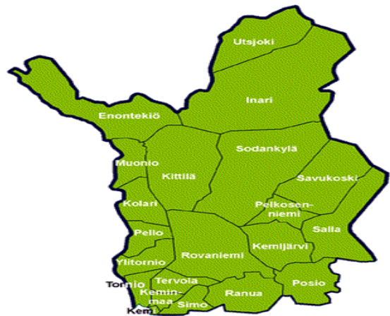
Kuvio 1 Lapin kunnat

Suomessa Ruotsin tai Norjan kanssa rajan jakavia kuntia ovat Utsjoki, Inari, Enontekiö, Pello, Tornio, Ylitornio, Kolari ja Muonio (Kuvio 1). Pohjoismaiden välillä valtion rajojen ylittäminen käy huomaamatta. Autolla ajaessa rajaa ei välttämättä edes huomaa, kun valtioraja ja tulli vilahtaa ohi. Rajaseutualueet ovat kaukana kansallisvaltioiden keskuksista kuten pääkaupungeista. Teknologian, pohjoisten luonnonvarojen, globalisaation ja saame-laisten identiteettityön ansiosta rajaseutualueille on muodostunut uusia mahdollisuuksia kehittyä sekä lisätä paikallista hyvinvointia. (Koivumaa, 2011,108;125.) Erityisesti Lapin matkailuun on panostettu viime vuosina voimakkaasti, mikä osaltaan on luonut uusia työpaikkoja ja tätä kautta elinkeinon useille Lapin asukkaille.