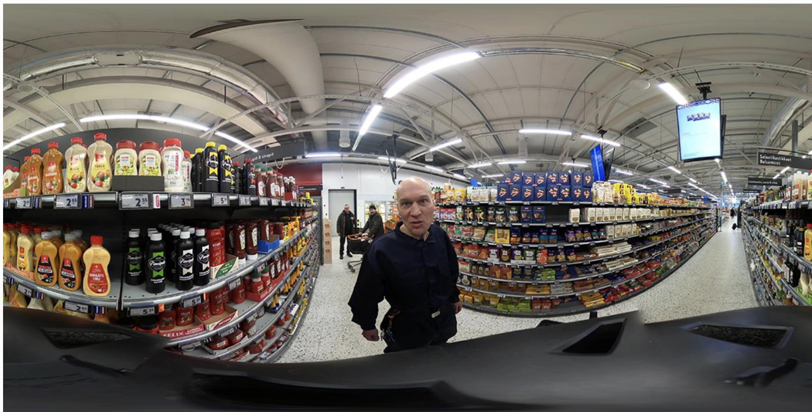
Ruutukaappaus VR-altistusvideosta "myymälävaras".

Myötätuntokeskeinen terapia + Virtuaali- todellisuudessa tapahtuva taitoharjoittelu tunnekylmille nuorille rikoksentekijöille