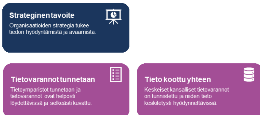
Kuva 4. Organisaation strategisen tavoitteen asettamisen edellytyksiä

Riittävät tietovarannot ovat organisaatioille elinehto. Tämä ei kuitenkaan vielä usein näy strategioissa. Tietovaranto hyvin usein liittyy kiinteästi toimijan perustehtävän hoitamiseen. Tapahtumat ja päätökset kirjataan tietovarantoihin (rekistereihin) sekä käsitellään automaattisesti. Tämän aseman tunnistamiseen liittyy hyvä tuntemus omista ja muilta käytössä olevista tietovarannoista.