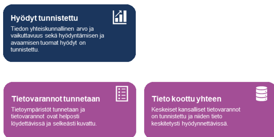
Kuva 3. Hyötyjen tunnistamisen edellytyksiä organisaatiossa

Asiakaslähtöisyys liittyy erityisesti erilaisiin palveluihin. Automaation lisääminen tai muutoin ennakoiva palvelu ovat esimerkkejä tilanteista, joissa asiakkaiden hallinnollista taakkaa voidaan vähentää merkittävästi. Ne perustuvat viranomaisten hallussa olevan tiedon hyödyntämiseen. Nämä kolme tiedonhallintaan liittyvää tavoitetta luovat pohjan. Lisäksi tarvitaan esimerkiksi yhteentoimivuuden kehittämistä. Tietoturvasta ja tietosuojasta on huolehdittava kaikissa tilanteissa.