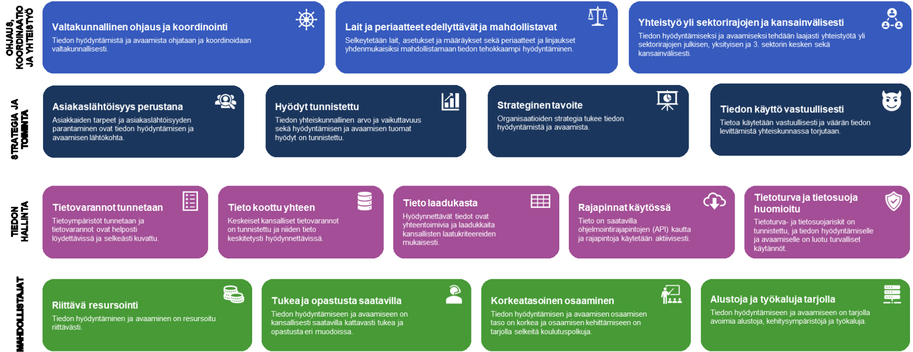
Kuva 1. Tietopolitiikan strategiset tavoitteet – kohti kattavaa tiedon hyödyntämistä ja avaamista.