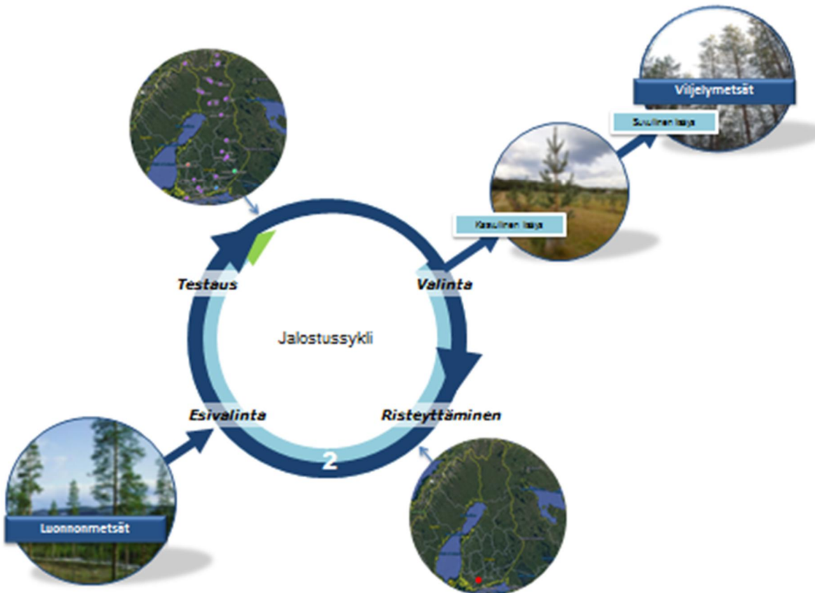
Kuva 1. Metsänjalostuksen sykli sekä yhteys siemenviljelyyn ja metsänuudistamiseen. (Kuva: Matti Haapanen, Luonnonvarakeskus).

Metsänjalostuksessa luonnossa eri yksilöissä esiintyviä edullisia perintötekijöitä rikastetaan sukupolvesta toiseen toistuvan testauksen, valinnan ja risteyttämisen avulla (kuva 1). Kunkin sukupolven parhaat puut valitaan tuottamaan metsänviljelyaineisto. Männyllä ja kuusella testaus- ja risteytysvaihe kestävät kumpikin noin 10–15 vuotta ja jalostussyklin koko pituus on noin 20–30 vuotta.