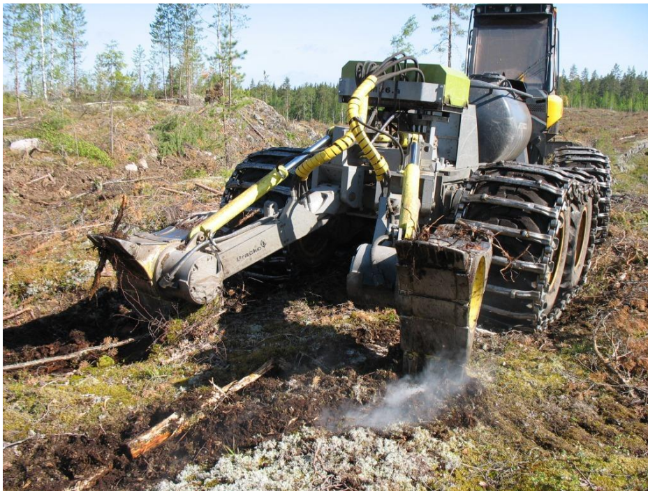
Kuva 3. Suurin osa Suomessa vuosittain tuotetusta siemenestä kuluu männyn metsäkylvöön. Valtaosa metsäkylvöstä tehdään koneellisesti maanmuokkauksen yhteydessä. Yhtä vakiintunutta tainta kohden joudutaan nykyisin kylvämään keskimäärin kymmenen itämiskykyistä siementä.

Työryhmän arvion mukaan siemenen kulutusta on mahdollista tutkimuksen ja menetelmäkehityksen avulla pienentää metsäkylvössä. Kehittyneemmän metsäkylvöteknologian käytäntöön vientiä tulee tehostaa.