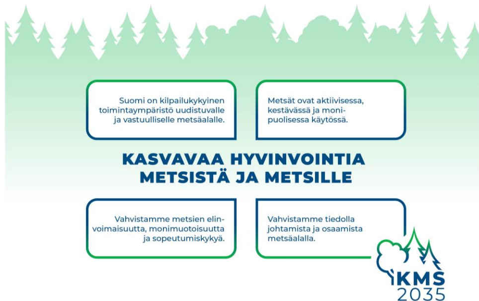
Kuvio 4. Metsästrategian visio ja päämäärät.