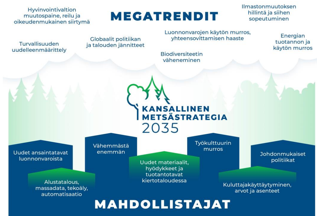
Kuvio 2. Metsäalaa vaikuttavia megatrendejä ja mahdollistajia.

Muutostekijöiden tunnistaminen ja ennakointi on haasteellista, mutta silti välttämätöntä (kuvio 2). Kehittämistoimenpiteiden osuvuus edellyttää, että pyritään systemaattisesti tunnistamaan metsäalaa liittyviä epävarmuuksia ja riskejä sekä niiden vaikutuksia.