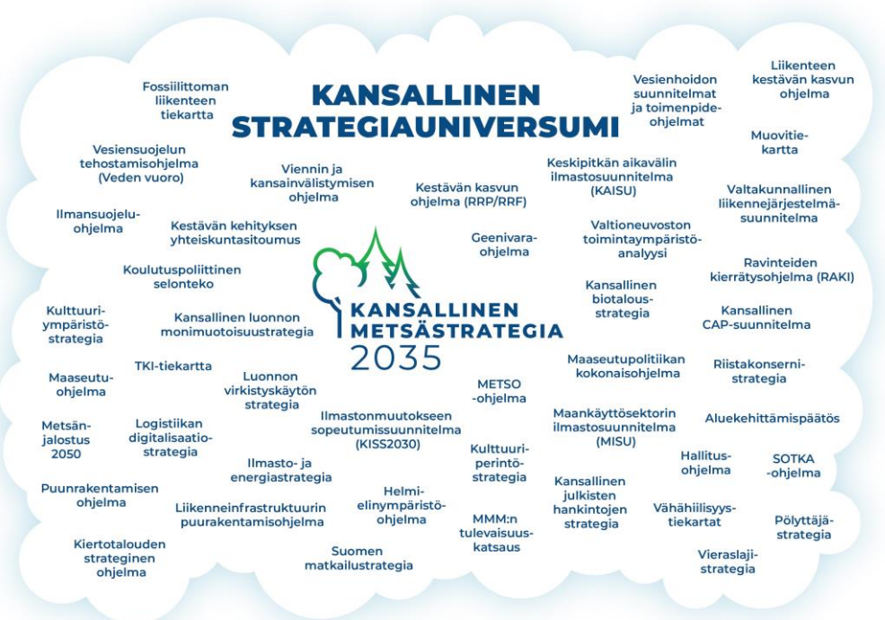
Kuvio 3. Kansalliseen metsästrategiaan linkittyviä kansallisia strategioita ja ohjelmia.

ja sen tavoitteisiin. Metsästrategialla on runsaasti liittymäkohtia muun muassa biotalousstrategiaan, luonnon monimuotoisuusstrategiaan, luonnon virkistyskäytön strategiaan, ilmasto- ja energiastrategiaan sekä maankäyttösektorin ilmastosuunnitelmaan (MISU) ja ilmastomuutokseen sopeutumissuunnitelmaan (KISS2030). METSO- ja Helmi-ohjelmat täydentävät kansallista metsästrategiaa ekologiseen kestävyteen liittyvissä tavoitteissa.