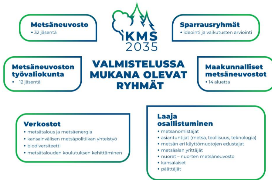
Kuvio 1. Metsästrategian valmisteluun osallistuneet ryhmät.

Kansallinen metsästrategia on yhteensovittava elinkeinostrategia, jossa otetaan huomioon niin ihminen, ympäristö kuin talous. Se kattaa metsätalouden ja -teollisuuden lisäksi myös metsien muihin sekä aineellisiin että aineettomiin tuotteisiin perustuvan tuotannon, jalostuksen, palvelut ja julkishyödykkeet sekä metsäalan osaamis- ja koulutuskysymykset. Strategialla on liittymäkohtia useisiin kansainvälisiin ja kansallisiin strategioihin ja ohjelmiin. Kansainväliset sekä EU:n metsä-, energia- ja ympäristöpoliittiset sitoumukset ja sopimukset vaikuttavat merkittävästi Suomen metsäsektoriin. Yhdistyneiden kansakuntien (YK) prosesseissa muotoutuu, millaisen roolin metsät maailmanlaajuisesti saavat tulevaisuuden haasteiden ratkonnassa. Suomi on sitoutunut ekologisesti, taloudellisesti ja sosiaalisesti kestävään kehitykseen (Agenda 2030-toimintaohjelma).